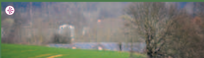
Van op de Grotstraat, zicht over de groene IJsevallei